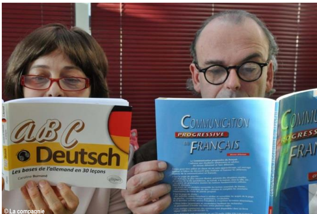
dans le cadre des Midi Théâtre !