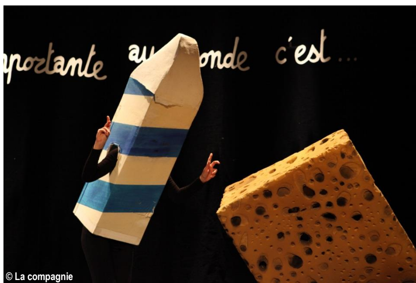
© La compagnie Contes abracadabrants – création 2014 de la Cie de L'éfrangeté

Contes abracadabrants de la Cie de l'Efrangeté, créé en 2014 à Nuithonie, a tourné (Nuithonie, Villars-sur-Glâne, les 29 jan.-9 fév. 14 (11 repr.)) au Théâtre Palace, Bienne, le 17 janv.16 (1), au Casino Théâtre, Rolle les 22-23 janv. 16 (2), au Théâtre Benno Besson, Yverdon, le 31 janv. 16 (1), au Reflet Théâtre, Vevey, le 7 fév. 16 (1), au Festival Région, Cran-Grevier (FR), le 9 fév. 16 (1), à l'Arbanel, Treyvaux, le 13 fév. 16 (1), au Théâtre du Crochetan, Monthey, le 27 fév. 16 (2), au Petit Théâtre, Lausanne, les 9-13 mars 16 (5), à l'Am Stram Gram, Genève, les 15-20 mars 16 (3) et au TPR, La Chaux-de-Fonds, le 23 mars 16 (1), soit au total 29 représentations.