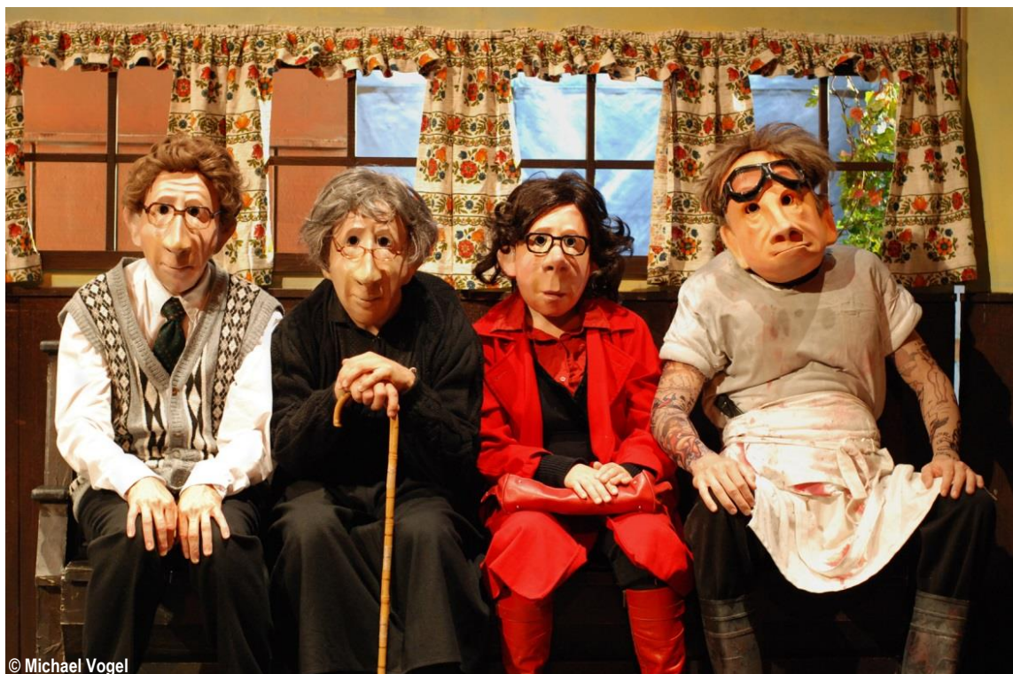
© Michael Vogel Hotel Paradiso de la Famille Flöz

La salle de conférence à Equilibre répond à un véritable besoin. En effet, durant l'année 2015, c'est près de deux cents séances organisées soit par la Fondation, soit le Service culturel ou encore Fribourg Tourisme et région qui y ont eu lieu.