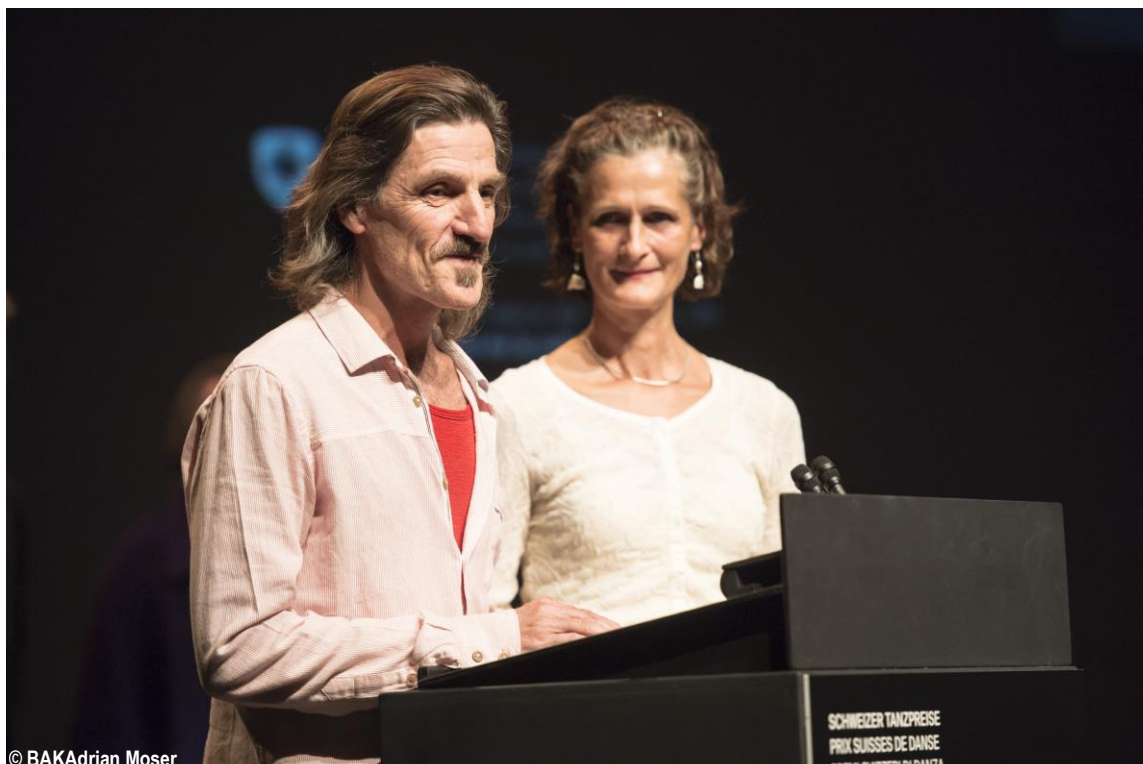
© BAKAdrian Moser Prix suisse de danse 2015 – DA MOTUS ! « souffle » (création actuelle de danse)