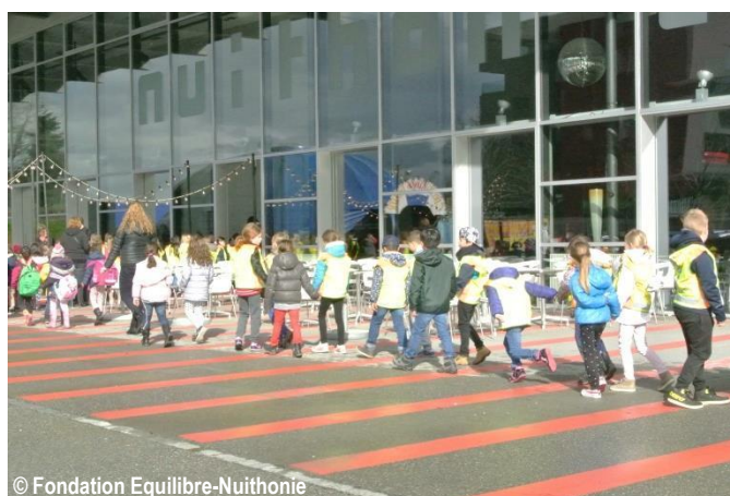
Enfants allant à une représentation scolaire à Nuithonie

En 2015, 49 représentations scolaires ont été proposées dans le cadre de la Saison des écoles, dont 29 à Nuithonie, 5 à Equilibre et 15 dans les communes membres de Coriolis Infrastructures avec le spectacle itinérant Le camion à histoires . Le nombre de représentations scolaires est passé de 55 en 2014 à 49 en 2015, soit une différence de -11% ; le nombre d'élèves et d'étudiants qui ont fréquenté la Saison des écoles est passé quant à lui de 9'507 en 2014 à 6'146 en 2015, soit une différence de -35%. La forte diminution du nombre d'élèves s'explique par le fait que 2014 a été une année extraordinaire en terme de fréquentation puisqu'un grand nombre de spectacles a été joué dans des salles à jauge plus grande.