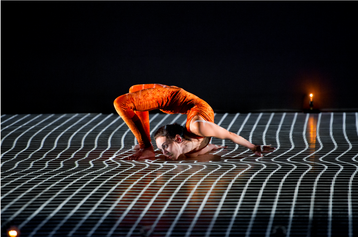
Pixel à Equilibre