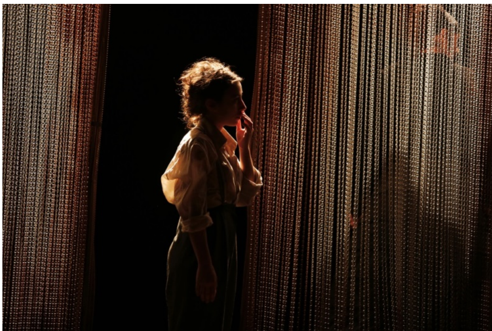
On ne badine pas avec l'amour à Nuithonie © Mario Del Curto

Le renouvellement de la saison des écoles a encore une fois été possible grâce au partenariat Culture et Ecole conclu avec la Direction de l'Instruction Publique du Canton de Fribourg qui a participé pour moitié au paiement des cachets versés aux compagnies, pour un montant maximal de Fr. 30'000.- par année scolaire. Ce soutien a permis de faciliter la venue des classes en proposant un prix de vente particulièrement accessible pour les représentations scolaires.