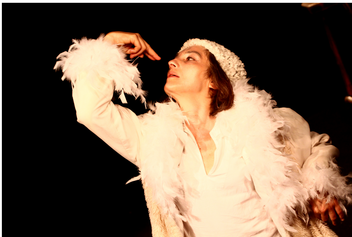
Histoire d'un merle blanc à Nuithonie