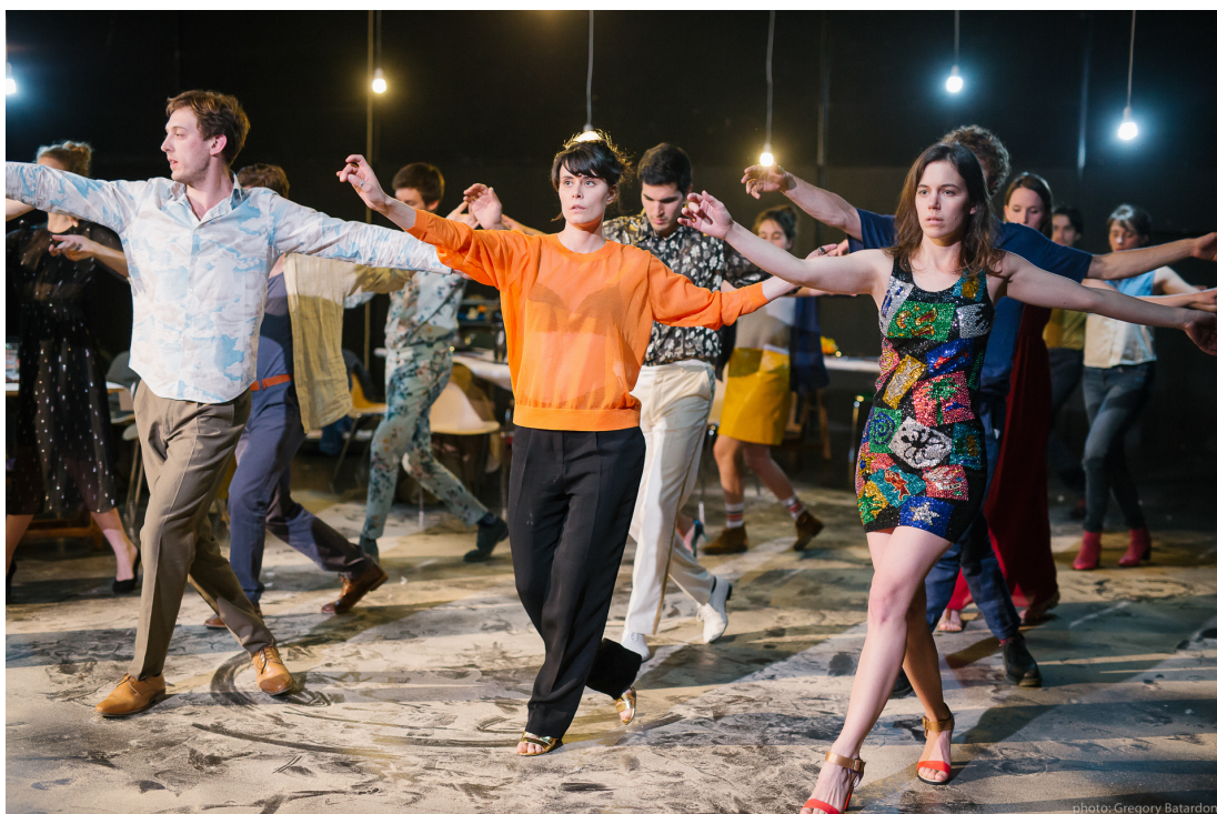
Spectacle de la Manufacture à Nuithonie

Nuithonie a accueilli le spectacle de sortie de la promotion H du Bachelor Théâtre de la Manufacture, Haute Ecole de Théâtre de Suisse romande à Lausanne. Du 24 au 25 mai 2016, les spectateurs de Nuithonie ont pu assister au spectacle Si seulement j'avais une mobylette, j'aurais pu partir loin de tout ce merdier... mis en scène par Frank Verduyssen. Il a proposé aux comédiens de se confronter à un processus de création collective, à l'instar du travail qu'il réalise depuis plus de vingt ans au sein du collectif tg STAN. Ils se sont donc plongés dans deux univers : celui, drôle et désespérant, décalé, des films du suédois Roy Andersson, et celui de la littérature arabe, classique ou contemporaine, de sa poésie et de ses grands conteurs. Après avoir exploré de nombreuses œuvres, les comédiens ont ainsi construit un montage de scènes plus ou moins réalistes, un assemblage de récits combinant humour et poésie, dans un choc des cultures dont le but final ne serait que de faire émerger des points de partage et de beauté.