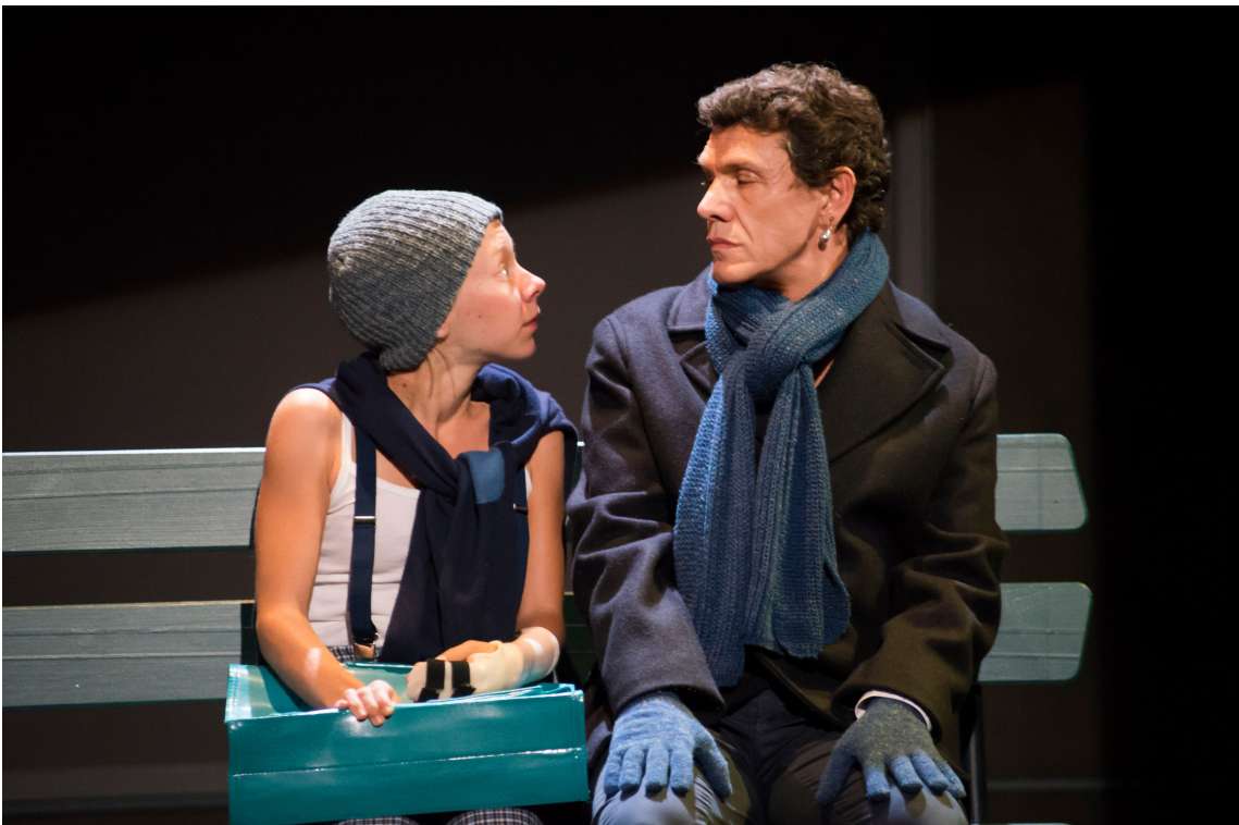
Le Poisson belge à Nuithonie