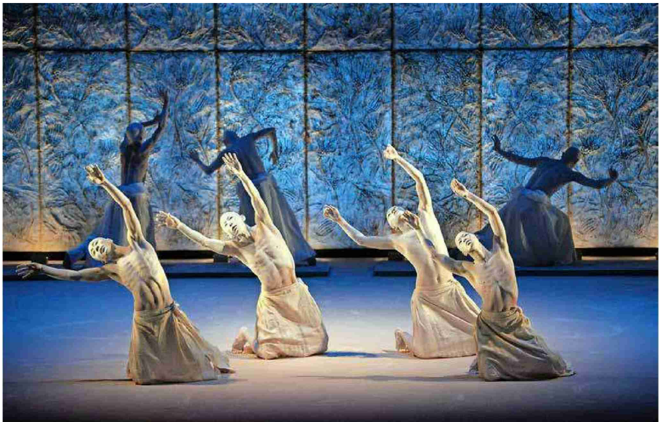
Le corps recouvert de blanc, les danseurs de Meguri évoluent dans un univers esthétique d'une beauté époustouflante. Sankai Juku