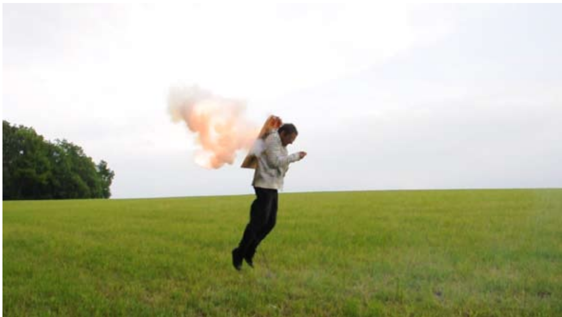
Tentative de décollage #3 (2011)