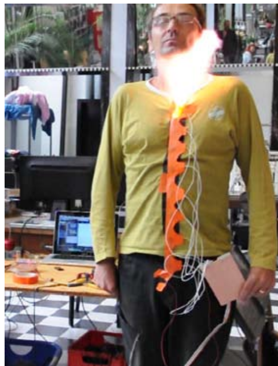
Bouttonnière , étude sur la synchronisation musicale des explosifs (2011)