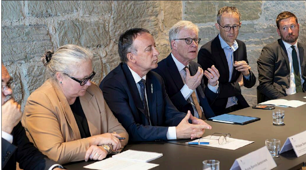
C'est in corpore que le Conseil d'Etat est venu commenter les résultats.